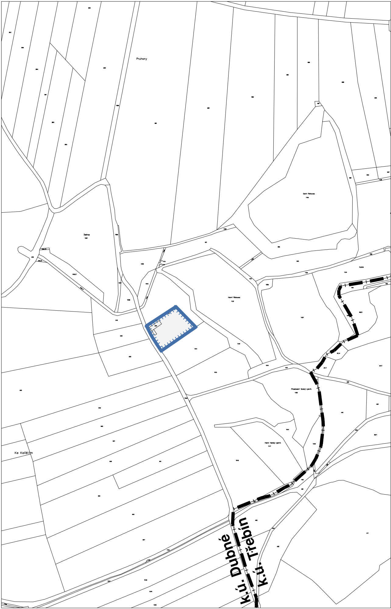
k.Ú. DUBNÉ- LOKALITA 5a