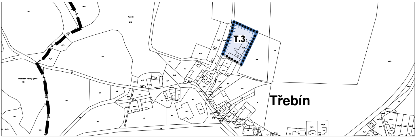
k.Ú. JARONICE, KŘENOVICE U DUBNÉHO A TŘEBÍN - LOKALITY 5c