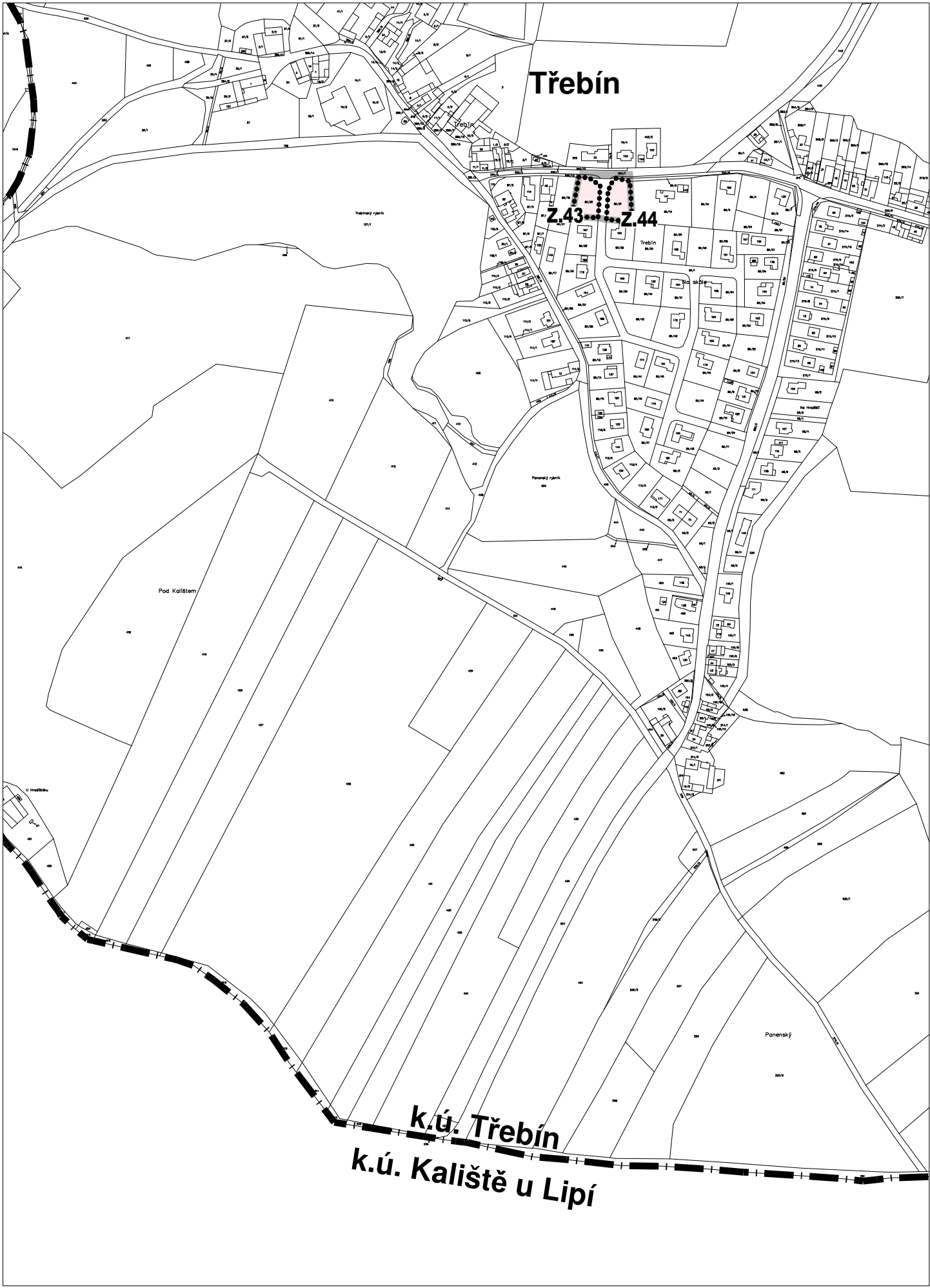
k.Ú. TŘEBÍN - LOKALITA 5b