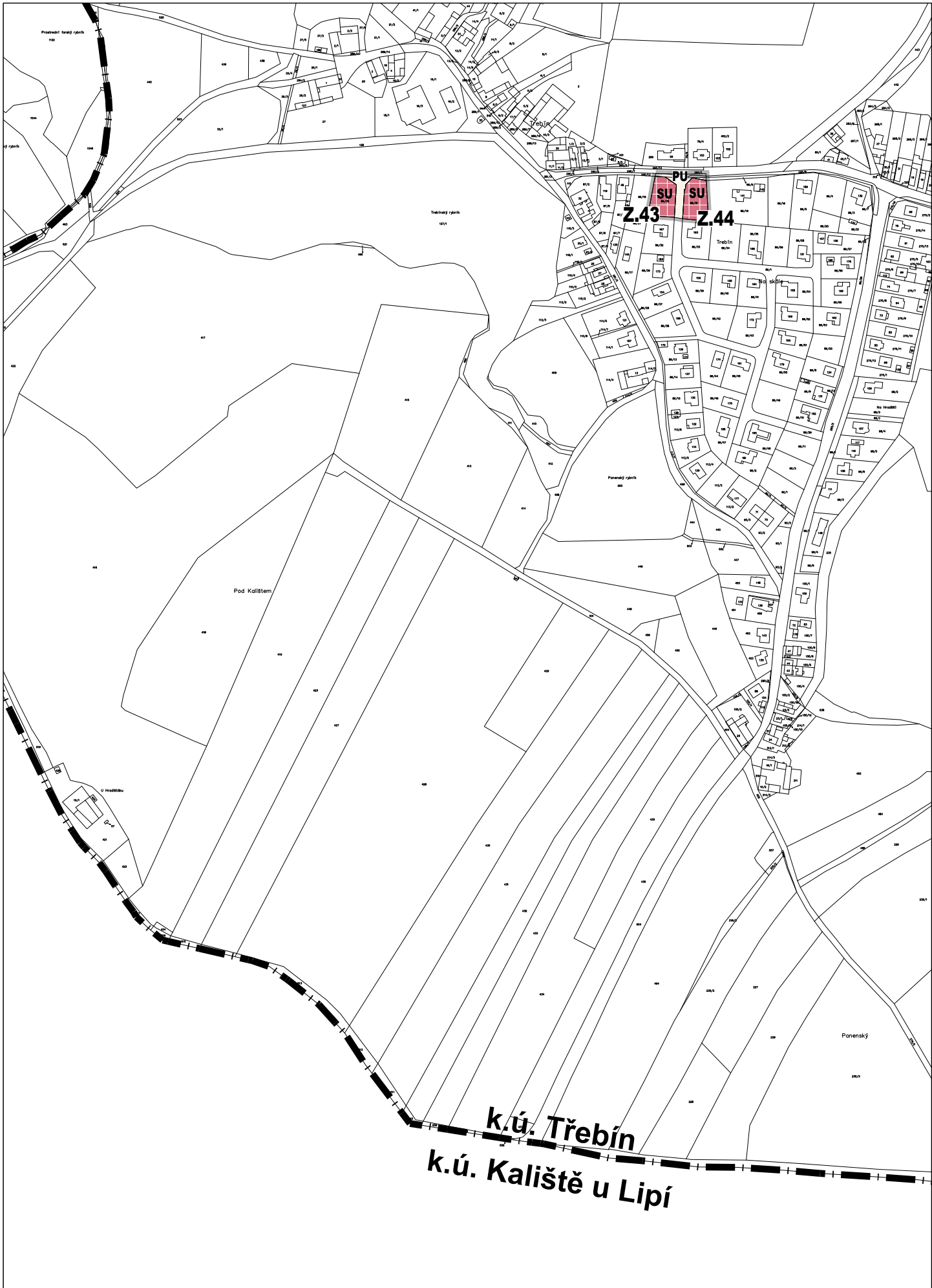
k.Ú. TŘEBÍN - LOKALITA 5b