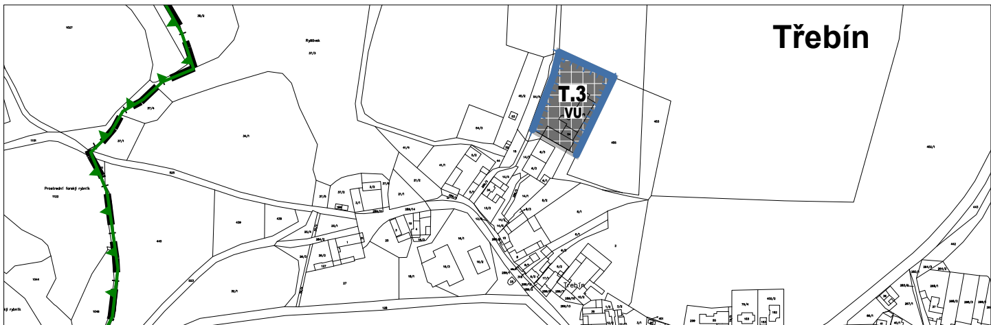
k.Ú. JARONICE, KŘENOVICE U DUBNÉHO A TŘEBÍN - LOKALITY 5c