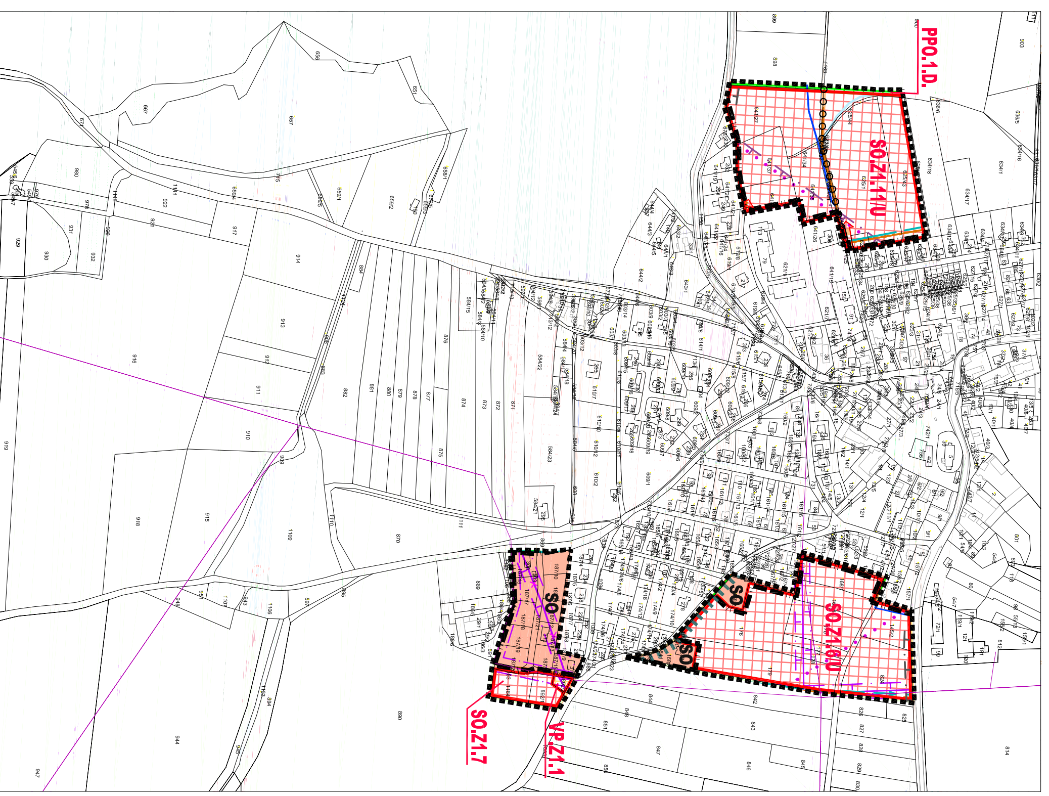
LOKALITA Z.1.B. - Dubné