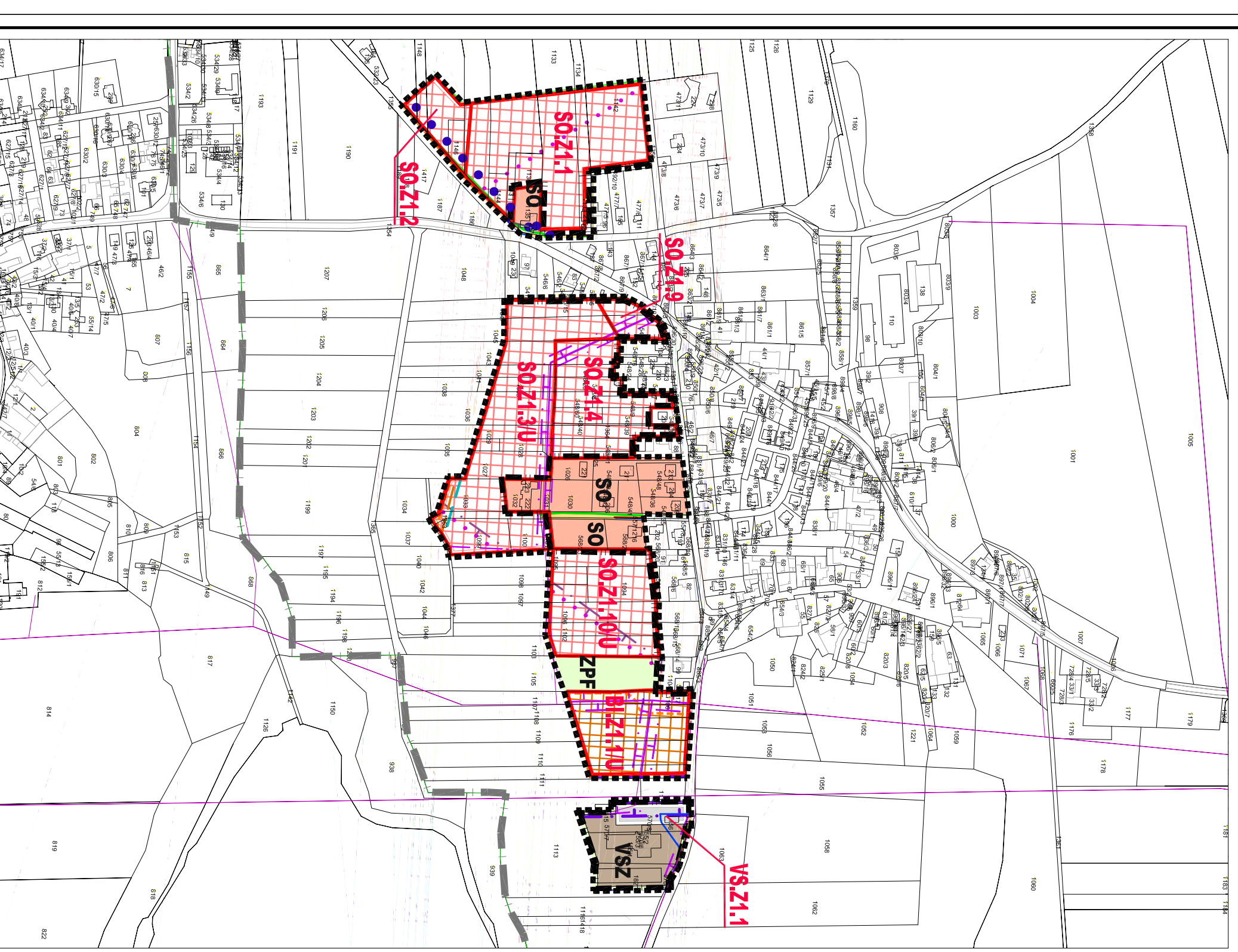
LOKALITA Z.1.A. - Křenovice u Dubného