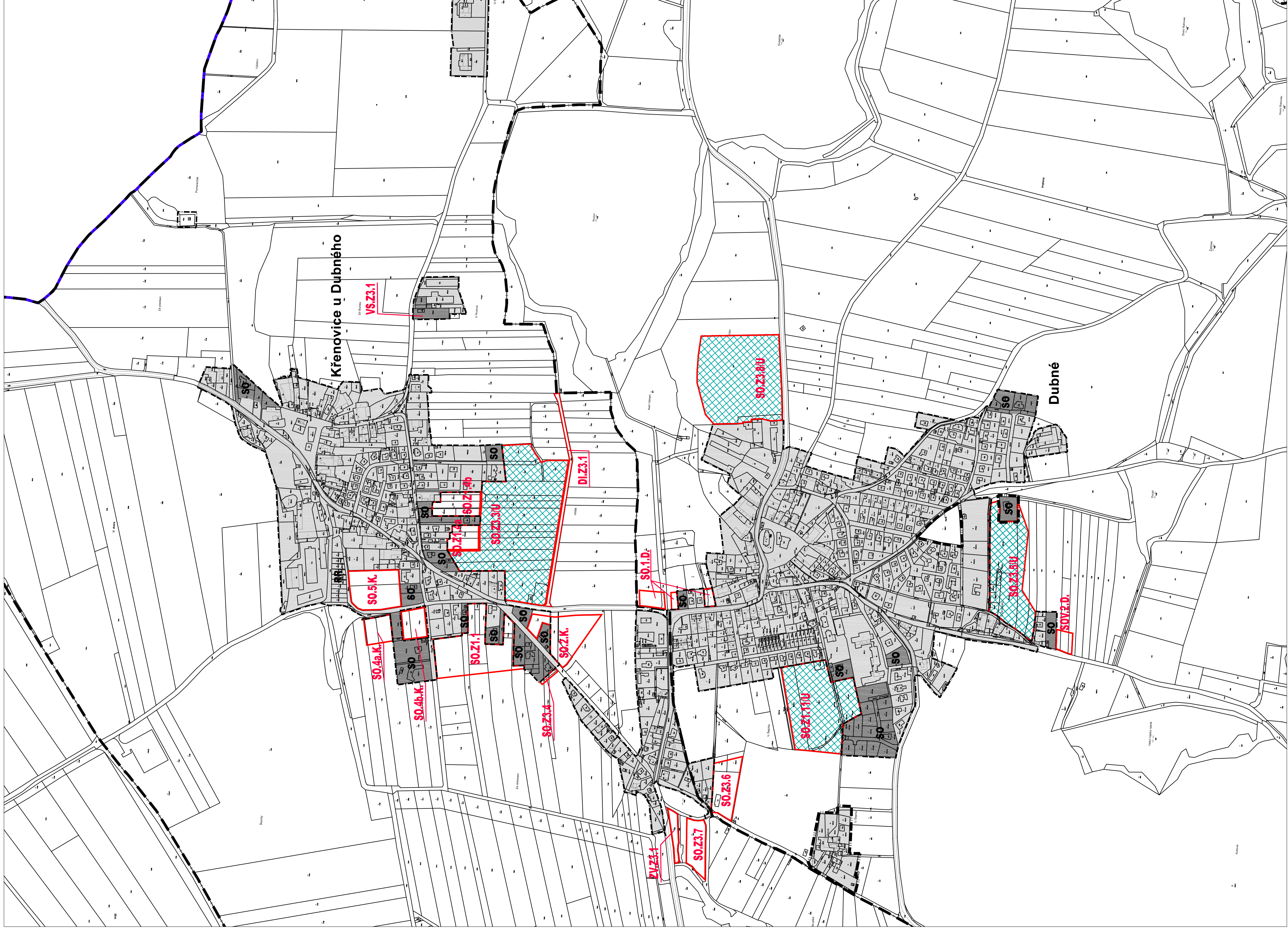
k.ú. Křenovice u Dubného , k.ú. Dubné